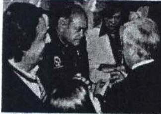
Ulloa le habló de indultos al Presidente.